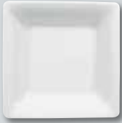
OCR-Nr. 16-3334-2130 220 x 220 mm · 8 ⅔ x 8 ⅔ in. Deep square plate · Assiette creuse carrée Teller tief, quadratisch · Plato hondo cuadrado Piatto fondo quadrato