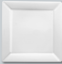
OCR-Nr. 16-3334-2140 320 x 320 mm · 12 ½ x 12 ½ in. Buffet plate · Assiette d'accueil · Platzteller Plato presentación · Piatto segnaposto