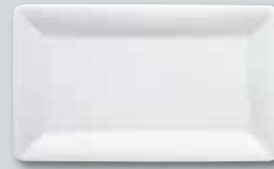
OCR-Nr. 16-3334-2850 320 x 190 mm · 12 ½ x 7 ½ in. Rectangular platter · Plat rectangulaire Platte rechteckig · Fuente rectangular Piatto grande rettangolare